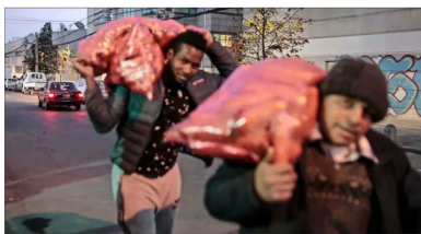
Según el informe elaborado por la Dipres, los migrantes en Chile provienen en su mayoría de Perú, Colombia y Venezuela. Se encuentran distribuidos principalmente en la zona norte y central del país.

La presentación del informe a la comisión mixta de Presupuestos en el Senado generó dudas en los parlamentarios, quienes pre-