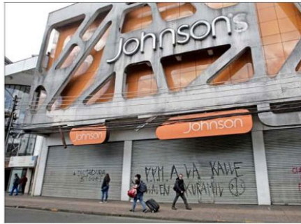
El comercio ha permanecido cerrado en varios puntos del país por la emergencia.