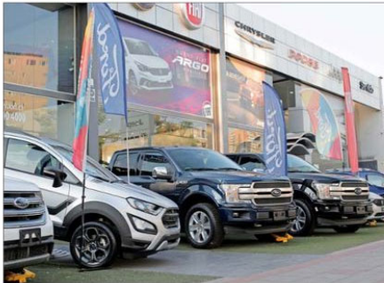
Entre enero y mayo pasado se comercializaron 93.772 vehículos, lo que representó una baja de 40,9% frente a igual lapso de 2019.