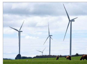
Caída del costo marginal de la energía podría complicar a las nuevas iniciativas en materia de estructura financiera.

El analista aéreo Ricardo Delpiano explicó que la conectividad nacional será una de las grandes perjudicadas por la pandemia. Según él, lo más probable es que las rutas interregionales dentro del país desaparezcan. "Lamentablemente, vamos a volver a una aviación como la que teníamos en los años 90, donde la conectividad era básicamente entre capitales y con las ciudades más importantes en términos internacionales", aseguró Delpiano sostuvo que a partir de 2022, las líneas aéreas podrán evaluar volver las frecuencias secundarias.