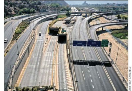
El flujo de vehículos en las carreteras urbanas ha caído fuertemente por las cuarentenas y el teletrabajo.