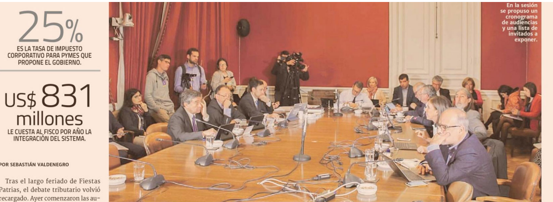
En la sesión se propuso un cronograma de audiencias y una lista de invitados a exponer.

25% ES LA TASA DE IMPUESTO CORPORATIVO PARA PYMES QUE PROPONE EL GOBIERNO.