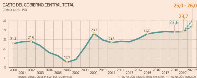
GASTO DEL GOBIERNO CENTRAL TOTAL COMO % DEL PIB