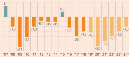
RESULTADO FISCAL ESTRUCTURAL COMO % DEL PIB