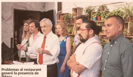
Problemas al restaurant generó la presencia de Piñera.

Cuando aún no se apagaban los ecos del plan reactivador de la economía presentado en la víspera, el presidente de la República, Sebastián Piñera, sorprendió ayer al revelar la entrega de un bono promedio de $ 100 mil.