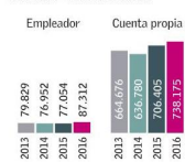
Trimestre móvil noviembre - enero de cada año