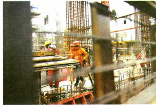
► Construcción arrastró nuevamente a la baja el indicador en septiembre.

Esto pese a que en septiembre el Imacec fue de 1,3%, bajo las expectativas, impactado por dos días hábiles menos.