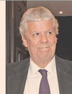
Nicolás Eyzaguirre, exministro de Hacienda.

“ La experiencia de estos 30 años de autonomía del Banco Central reflejan la incidencia positiva que ésta ha tenido en el manejo macroeconómico del país y, en consecuencia, debiera mantenerse”.