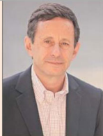
José de Gregorio, expresidente del Banco Central y exministro de Economía y Energía.

“ El otorgamiento de autonomía a la autoridad monetaria ha sido una forma de establecer un compromiso creíble con la estabilidad de precios y, a la vez, permitirle implementar una política monetaria que contribuya a suavizar el ciclo económico. En la medida en que el Banco Central sea independiente de las necesidades de financiamiento del gobierno, se elimina el sesgo inflacionario atribuible al financiamiento de un déficit público recurrente”.