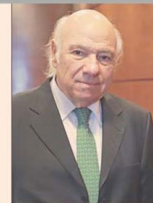
Vittorio Corbo, expresidente del Banco Central.

“Las decisiones de política monetaria, por su complejidad e impacto, deben ser prescindentes de la contingencia política”.