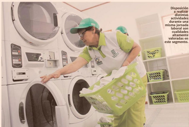
Disposición a realizar distintas actividades durante una misma jornada laboral son cualidades altamente valoradas en este segmento.

19% DE LOS TRABAJADORES DEL COMERCIO SON ADULTOS MAYORES.