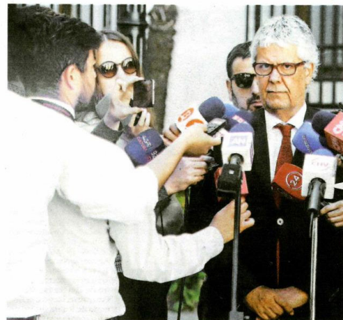
► El ministro de Hacienda, Nicolás Eyzaguirre, en el patio de La Moneda.

El mercado y el propio BC apostaban por una cifra bajo 3%, pero el penúltimo mes del año pasado sorprendió con una expansión de 3,2% impulsada por el sector no minero. Perspectivas para PIB 2017 se movieron al alza.