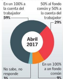
Fuente Estudio de Opinión Pública: Debate 5% de cotización adicional, Cadem

¿Usted cree que los fondos propuestos por el Gobierno para mejorar las pensiones, que provienen de un 5% extra de cotizaciones al trabajador y que pagará el empleador, deberían ir...?