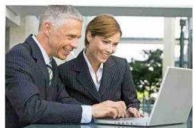
No existe una solución única que sea aplicable a todas las empresas, destaca el profesor Polanco.

Dado este contexto, es razonable que surja la pregunta acerca de cómo enfrentar de mejor manera el desafío de ponerse al día con la reforma. Un primer consejo, es conservar la calma. La declaración de renta del año tributario 2017 se hace con la información del año comercial 2016, y recién el siguiente año, esto es, el año tributario 2018, necesitamos declarar en nuestra renta un