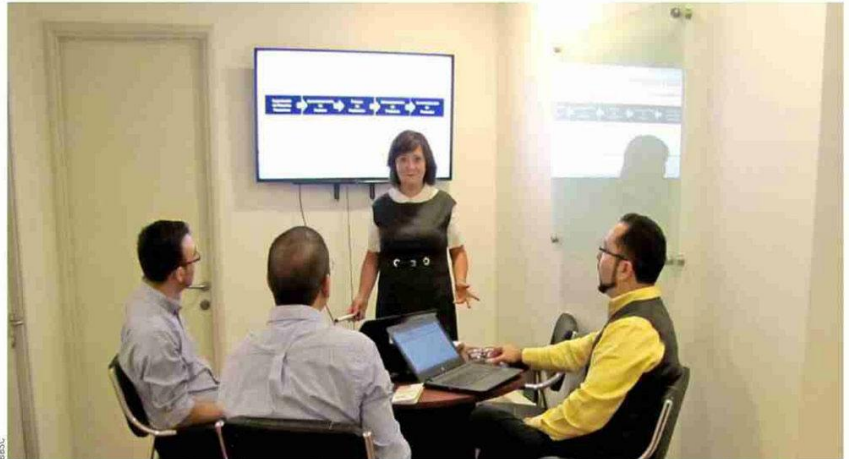
Esta compañía se preocupa de capacitar a su equipo.

optar por un régimen 14B Semi Integrado como consecuencia del abanico societal, estructurado por abogados, a expensas de la generación de valor; es decir, finalmente, a expensas de la generación de riqueza. En esta línea, la nueva mirada tributaria es específica y certera en la ley, otorgándole al Servicio de Impuestos Interno atribuciones que antes no tenía, como tasar la base imponible, pedir el término de giro o de calificar los actos abusivos de la ley, los que han mermado