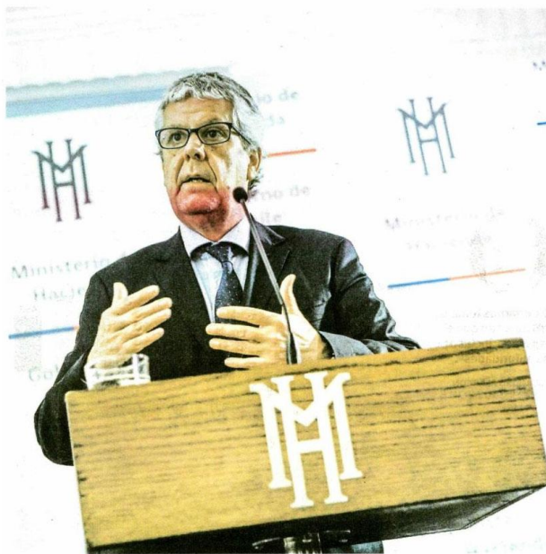
► El ministro de Hacienda, Nicolás Eyzaguirre, celebró el positivo registro de julio.

De la mano de la recuperación de la minería, el Imacec de julio superó las expectativas, con el cobre, asimismo, escalando a US$ 3,13 la libra. Desde el sector privado creen que las proyecciones de 2017 y 2018 pueden mejorar.