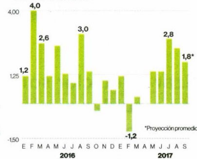
Comportamiento del Imacec Variación mensual en %