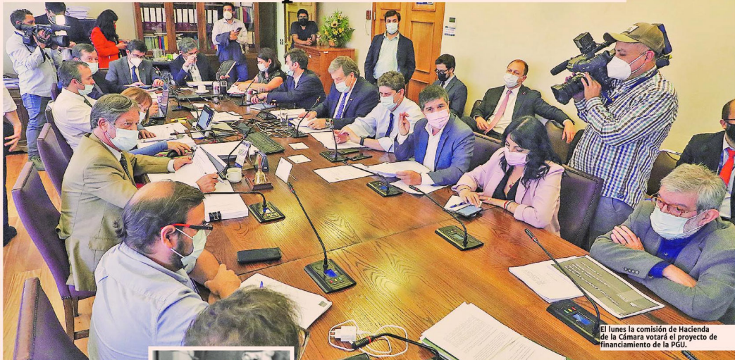
El lunes la comisión de Hacienda de la Cámara votará el proyecto de financiamiento de la PGU.

■ Carta de economistas ligados a la exNueva Mayoría encendió la disputa entre el Ejecutivo y el Congreso, que involucró también al comando del Presidente electo.