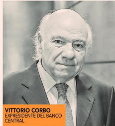
VITTORIO CORBO EXPRESIDENTE DEL BANCO CENTRAL

El expresidente del Banco Central, Vittorio Corbo, afirmó ayer que el perfil del futuro ministro de Hacienda del gobierno de Gabriel Boric es de "alguien que entienda muy bien las restricciones macroeconómicas que enfrenta el país" y "debe ser una persona que tenga ascendencia sobre los otros ministerios". En conversación con radio Infinita, planteó que Boric debe "ajustar su agenda", porque "en economía, si no se respetan las restricciones económicas, puede terminar en un accidente para el país". Y sostuvo que "una economía ordenada sirve para crear incentivos de crecimiento y para reducir la pobreza". Ya el jueves pasado el economista había dicho en el XVIII Seminario Perspectivas Económicas de Sura Inversiones que será clave para enfrentar la desaceleración económica el nuevo equipo económico y político que conforme, especialmente en el ministerio de Hacienda e Interior. "Estos nombramientos son cruciales para reducir la incertidumbre política, que está llevando a ajustes de portafolios hacia activos externos y a la sobre depreciación del peso".