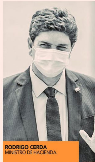
RODRIGO CERDA MINISTRO DE HACIENDA

"También es importante que la clase política pueda dar una respuesta a los chilenos y que por fin podamos aumentar las pensiones a los chilenos que están esperando este aumento de pensiones. Sería realmente incomprensible que no lo hicieran. Es el momento de que nos pongamos de acuerdo. Como gobierno estamos dispuestos a dialogar", cerró.