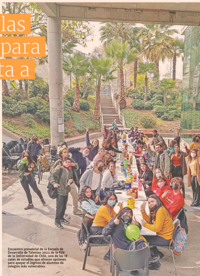
Encuentro presencial de la Escuela de Desarrollo de Talentos 2022 de la FEN de la Universidad de Chile, una de las 18 casas de estudios que ofrecen opciones para apoyar el ingreso de alumnos de colegios más vulnerables.

"Son estudiantes muy autoexigentes, están muy acostumbrados a tener muy buenos resultados en