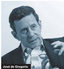
José de Gregorio

Por eso, la propuesta incluye un seguro familiar mensual de $126 mil por cada miembro y dado que la familia promedio en Chile tiene 3,1 miembros, el ingreso promedio que recibirían sería de $390 mil al mes. La medida beneficiaría a cerca de 1,7 millones de hogares, con un costo mensual cercano a US$790 millones. Para acceder a este seguro, las familias deben estar inscritas en el Registro Social de Hogares (que cubre al 74% de la población) para constatar que ningún miembro de la familia tenga trabajo formal (exceptuando a las trabajadoras de casa particular). El seguro será preferentemente recibido por la mujer del hogar en cuestión y distribuido por BancoEstado a través de la cuenta RUT. Adicionalmente, proponen que el Estado complemente con recursos del subsidio de desempleo los niveles de ingresos de los trabajadores en las empresas que, por razones justificadas y con acuerdo de sus sindicatos, no puedan pagar la totalidad de sus salarios en la emergencia. Y piden que así como algunas em-