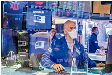
55% caen fondos chilenos que invierten en acciones de EEUU | Diario Financiero