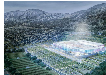
Avanza nuevo estadio de la UC: Penta, BICE Vida, Consorcio y Confuturo compran bono de Cruzados | Diario Financiero