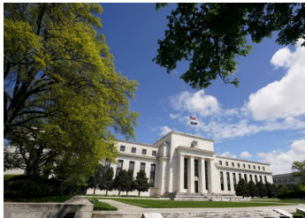
Fed sube la tasa en 75 puntos y presidente sugiere que podría haber un alza similar en julio | Diario Financiero