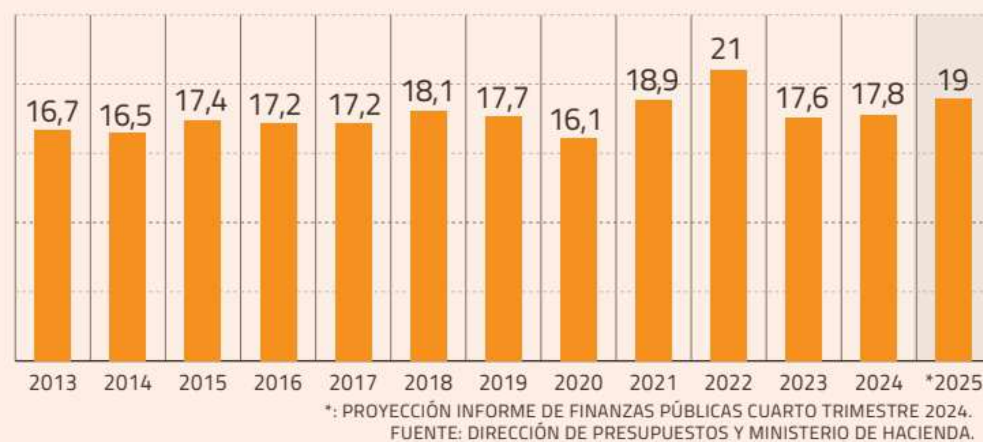
INGRESOS TRIBUTARIOS NETOS COMO % DEL PIB

cuando la economía continuó su tránsito de salida tras la pandemia. En 2015, la meta estuvo cerca de cumplirse, pero en el resto de los períodos no se logró el incremento total de recaudación esperado (ver gráficos).