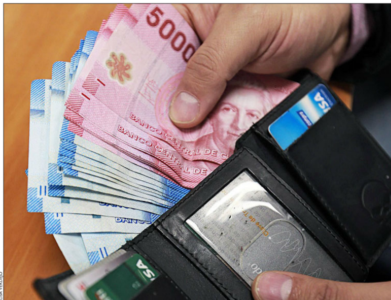
La gente de mayor ingreso y nivel de educación ahorra más, según informe de ABIF.

"El ahorro no previsional es muy bajo porque a la gente no le alcanza la plata para ahorrar, así de simple. Los salarios son muy bajos. Entonces, la única manera de que aumenten los salarios reales del país es que exista crecimiento económico. Por lo tanto, la única forma de que el país genere un nivel de ahorro más elevado es que el haya un mayor crecimiento", dice Alejandro Alarcón, académico de la Facultad de