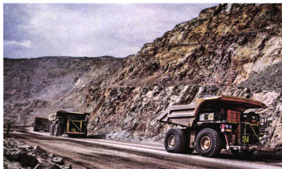
Minería tuvo su primera caída después de un año de alzas.