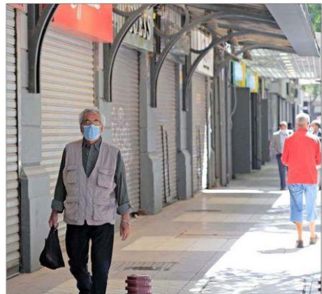
De los 2,6 millones de inactivos reportados en marzo, un 9% dice que no sale a buscar empleo producto de las cuarentenas.

Enfatizó que el Gobierno no cesará en continuar implementando programas de ayuda, tanto para que a través de subsidios los trabajadores puedan seguir contratados, como en la creación de empleos y recuperación de empleos perdidos. A ello se sumará el programa "Empléate", que se