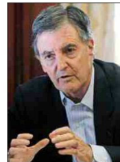
Manuel Melero , presidente de la CNC.

otros relacionados con el libre comercio. "Creo que es muy importante que Chile ponga la institucionalidad en los foros internacionales, el libre comercio o el libre flujo de inversiones", dijo.