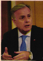
EMILIO SANTELICES MINISTRO DE SALUD

Distintos especialistas trabajando para los servicios de salud a lo largo de todo el país, en un refuerzo continuo, de 24 horas, todos los días. Son parte de las metas que se ha planteado el Minsal con la implementación del Hospital Digital, que también tendrá una ubicación física, no como la de un hospital clásico, sino algo más parecido a un centro de logística. El ministro Santelices señala que la ejecución de la primera parte tiene un presupuesto asignado de $ 31 mil millones. "La mayor parte de esos fondos está destinada a la adquisición de plataformas tecnológicas, programas y dispositivos, mientras que el resto va al capital humano requerido para la operación. Pero en el futuro, asumiendo el necesario recambio y modernización de lo ya señalado, la inversión mayor estará asociada a la operación, fundamentalmente al capital humano", sostiene. Junto al uso de plataformas convergentes, software y programas de integración, también habrá componentes tecnológicos relacionados con la transmisión de imágenes bajo un formato digital para facilitar la atención sincrónica y contribuir a la obtención de diagnósticos remotos, explica Santelices. Sobre el impacto que tendrá la incorporación de inteligencia aumentada y el uso de modelos predictivos, el ministro destaca la posibilidad de cambiar la mirada descriptiva