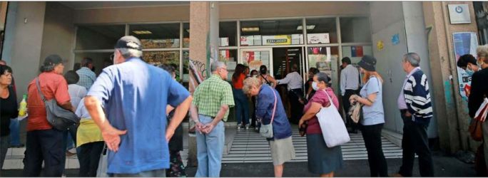
Expertos cuestionan el retiro de fondos, porque afectará a las pensiones de los futuros jubilados.

Según Ciedess, con datos de la Superintendencia de Pensiones, un 70% de los afiliados podría girar el piso mínimo de 35 UF que dispone la iniciativa.