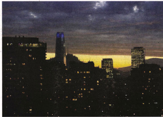
El PIB de Chile crecerá 3,8% en 2018 y 2019 según los economistas.

El ministro de Hacienda, Felipe Larraín, sostuvo que la cifra de 3,8% para este año, "es significativa" destacando que está incluso por sobre la estimación de la propia cartera (de 3,5%). "Nos alegramos que las expectativas me-