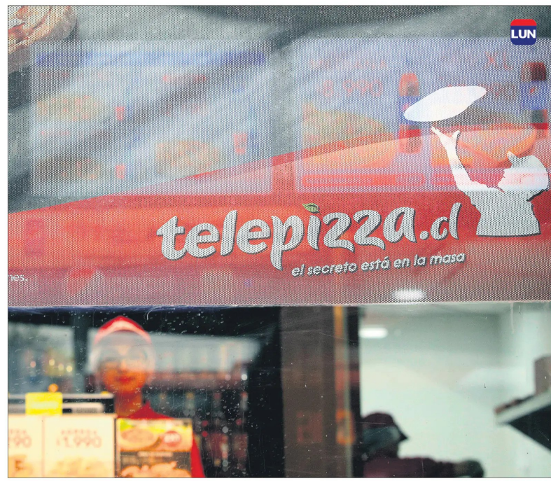
Entre ambas cadenas de pizzería suman más de 100 locales.

“La principal razón de la salida del grupo FDB es porque no fueron capaces de adaptarse a la transformación que ha ido viviendo el mercado en los últimos