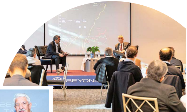
Toyota Chile estrenó "Beyond Talks", un ciclo de charlas magistrales, con la primera edición dirigida a los principales concesionarios y socios comerciales de la compañía.