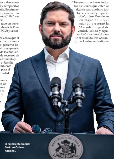
El presidente Gabriel Boric en Cadena Nacional.

"El presupuesto de 2026 se enfoca en continuar con la senda de crecimiento y avanzar en un desarrollo productivo que sea sostenible", dijo Boric en su último discurso en materia de presupuesto.