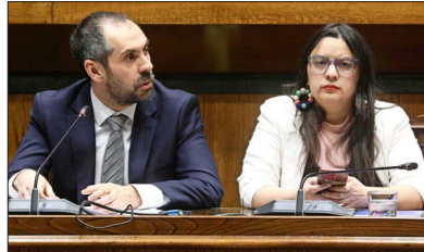
El ministro de Hacienda junto a la Directora de Presupuestos en la Comisión Especial Mixta de Presupuesto.