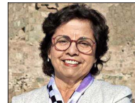
AURORA WILLIAMS Ministra de Minería

Abogada de la PUC y Mmagíster en Derecho de la Empresa de la U. de los Andes, preside esta Cámara que ha visibilizado las barreras que enfrentan las empresas para crear empleo formal. En 2025 ha impulsado el uso de tecnología para comba la informalidad laboral y promover oportunidades.