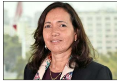
SOLANGE BERSTEIN Presidenta de la Comisión para el Mercado Financiero