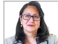
DOROTHY PÉREZ Contralora General de la República de Chile

Ha consolidado al Congreso Futuro como el principal espacio de divulgación científica de América Latina, lidera Proyecto Chile 2050, articulando a más de 2.000 expertos de distintos sectores para definir una hoja de ruta hacia el desarrollo sostenible del país, conectando ciencia, política y ciudadanía