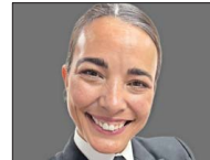
MARIANA ILLANES Capitán de Corbeta de Armada de Chile

Ingeniera civil y exministra de Transportes y Telecomunicaciones, en 2025 asumió la presidencia de las 43 empresas que integran COPSA. Impulsa el fortalecimiento de la colaboración público-privada y la apertura de nuevas áreas de desarrollo