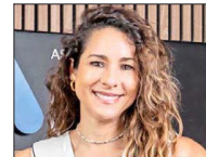
PAULINA YAZIGI Presidenta de la Asociación de AFP

Ingeniera comercial de la Universidad Católica del Norte, ha sido dos veces ministra de Minería. En su primera gestión impulsó la Mesa Mujer y Minería, que cumple 10 años y elevó la participación femenina del 8% al 23% en el sector. En 2025 encabeza la Estrategia Nacional del Litio y la primera Política de Minerales Críticos.