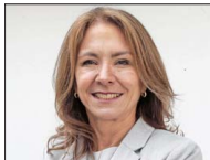
SUSANA JIMÉNEZ Presidenta de la Confederación de la Producción y del Comercio

Fue reconocida como Mujer Destacada del Agro por el Ministerio de Agricultura y ha fortalecido la presencia pública y digital del gremio de los productores lecheros del país, visibilizando el rol de la mujer en el agro y promoviendo políticas para un sector más sostenible, inclusivo y competitivo