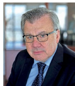
El super de Pensiones, Osvaldo Macías, fue elegido hasta 2028.

rio, lo que abriría la posibilidad de que el nuevo presidente anticipe la nominación de un reemplazo. Todos los consejeros del BC postulados por el presidente deben ser aprobados por la sala del Senado.