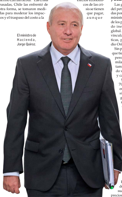
El ministro de Hacienda, Jorge Quiroga.

Contacta a tu ejecutivo EL MERCURIO ATENCIÓN COMERCIAL 2 2330 1221- 2 2330 1794 Publica tus avisos toda la semana