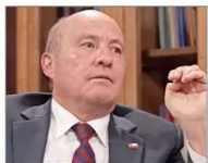
El ministro de Hacienda, Jorge Quiroz, fue el encargado de realizar el anuncio del alza de los combustibles.

El dirigente gremial también llamó a resolver el nuevo escenario de costos que tendrá el sector con los generadores de la carga que se transporta. "La pregunta es cómo los generadores de carga resuelven este problema. Habrá que responsabilizar también a los que dan la carga para que nosotros podamos abastecer al país y si hay un alza de esta envergadura es necesario que los generadores se pronuncien y actúen en consecuencia frente a este nuevo valor del diésel, que es extremadamente alto y es el insumo más importante para nuestra actividad", apuntó.