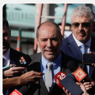
Ministro de Grange por tren rápido a Valparaíso: “El...”