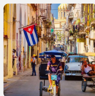
Dictadura cubana reconoce agotamiento del petróleo ruso y...