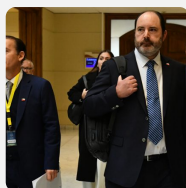
Ajuste fiscal golpea al Ministerio del Trabajo: recorte al Sence lleg...